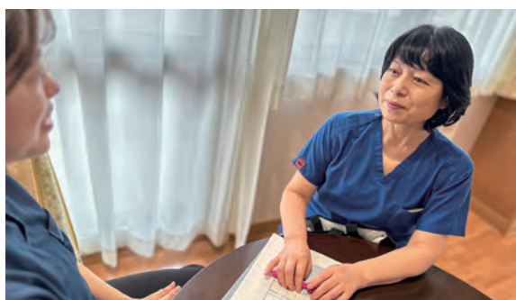
専門看護師等が支援

丸木記念福祉メディカルセンターでは、埼玉医科大学グループをはじめとして医療機関、施設、居宅介護支援事業所等との密な連携を図りながら、入院から退院までの流れをスムーズにし、患者様が安心して治療を受けられる環境を目指して、「入退院支援センター」を開設いたしました。