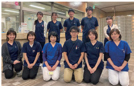
入退院支援センター