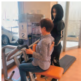
ジムトレーニング

MORO HAPPINESS 館では、地域社会と連携して健康いきがづくり事業に取り組み、住民の皆様が健康的な暮らしを身につけ、学びや情報交換ができる居場所をつくり、仲間づくりと共に支え合いの場を提供しています。レッスンは介護・認知症予防に特化した内容を用意しています。