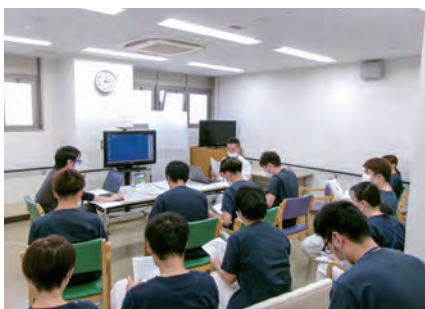
回復期リハビリテーション病棟

地域包括ケア病棟は、急性期治療を終えた患者様や、在宅療養中に状態が不安定になった患者様に対して、医療、介護、福祉サービスが連携して包括的なケアと多職種協働による質の高いケアを提供する病棟です。単に病状の治療や管理を行うだけでなく、患者様の生活状況、家族構成、地域環境なども考慮した個別ケアプランを作成し、住み慣れた地域で安心して生活を送れるよう支援します。