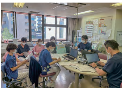
地域包括ケア病棟