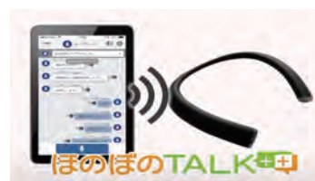
インカムとの連携