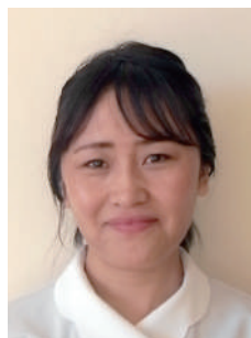
テンジンヤンドル

ベトナムから昨年11月にEPA（経済連携協定）で日本に来ました。ベトナムでは看護師の資格を持っています。日本の生活に早く慣れていきたいです。よろしく申し上げます。