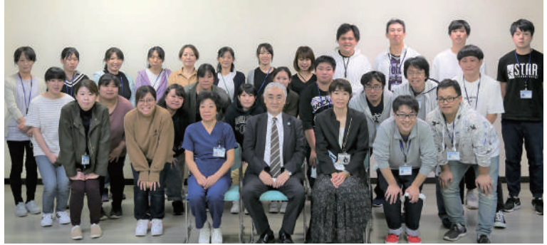
介護福祉士実務者研修 第1回生修了式

令和2年9月29日、埼玉医療福祉会介護福祉士実務者研修の第1回生26名の修了式が行われました。新型コロナウイルス感染予防の中で行なわれた本研修は受講生にとって苦労があったと思います。その中で教員とともに最後まで研修をやり遂げた受講生、本研修に携わった関係者には深く御礼申し上げます。