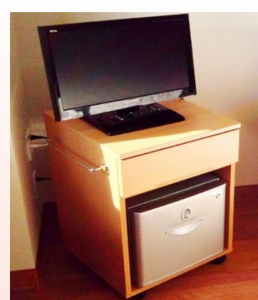
テレビ・冷蔵庫 (無料)

ご本人様・ご家族様のご要望に応じて、外出や外泊、在宅退院へのお手伝いもさせていただいております。また、在宅で生活される方への専門医による訪問診療も行っておりますので、ご希望ありましたらご相談ください。