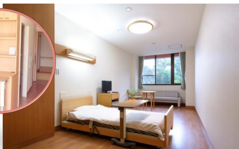
個室 トイレ無し 10,000円+税/日